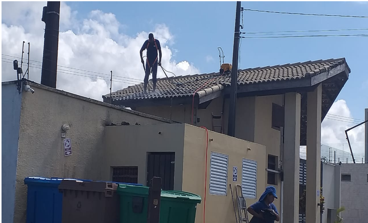
. Lavagem telhado Administração